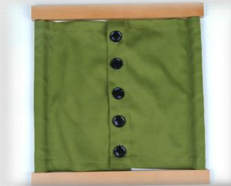
Igra – uši i odkopčaj dugme